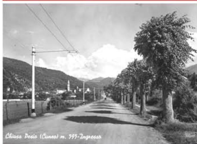
Chiusa Pesio (Cuneo) m. 1995 - Ingresso