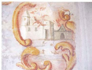
Particolare affresco Madonna di Pianpoussard (casa privata, zona Pradeboni)

Nella parte centrale in basso possiamo vedere i festeggiamenti dei paesani, svoltisi per