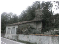
La fornace della calce con il magazzino antistante allo stajo ufficiale.